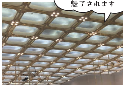
▲ANAクラウンプラザホテル宇部 3F 国際会議場 天井照明