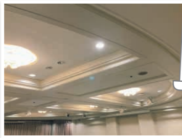
▲ANAクラウンプラザホテル宇部 2F 中宴会場(弥生) 天井