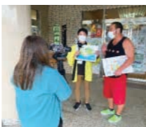
小野市民センター

●宇部市等と連携して、映画やテレビCMなどロケ地としての宇部の魅力を情報収集、効果的に映像制作会社等への対応