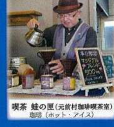
喫茶 蛙の匠(元前村珈琲喫茶室) 珈琲(ホット・アイス)