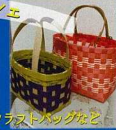
占い、布小物、クラフトバッグなど