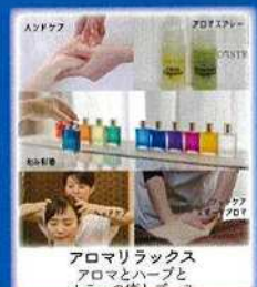
アロマリラックス アロマとハーブと カラーの癒しアース