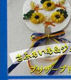
さぶあひあ&ジュエリーズポップコーン プリザーブドフラワー、ポップコーン