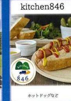
kitchen846 ホットドッグなど