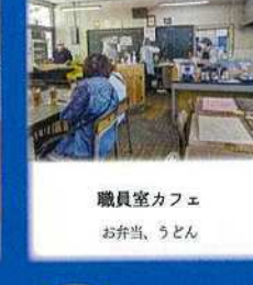
職員室カフェ お弁当、うどん