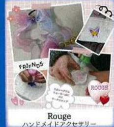
Rouge ハンドメイドアクセサリー