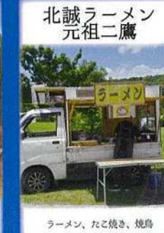
北誠ラーメン 元祖二鷹 ラーメン、たこ焼き、焼鳥