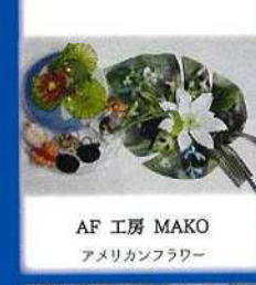
AF 工房 MAKO アメリカンフラワー