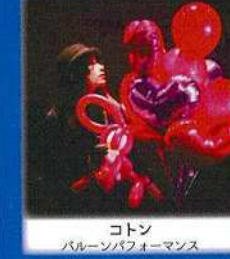
コットン バルーンパフォーマンス