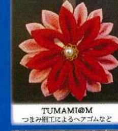
TUMAMI@M つまみ細工によるヘアゴムなど