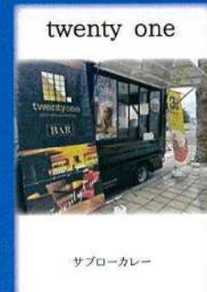
twenty one サブローカレー