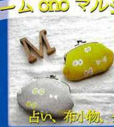
占い、布小物、クラフトバッグなど