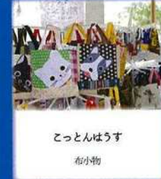
こっとなはうす 布小物