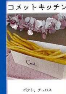
コメットキッチン ポテト、チュロス