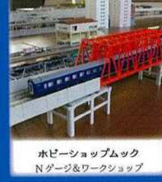
水びょうぶショップムック N グージ&ワークショップ