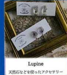
Lupine 天然石などを使ったアクセサリー