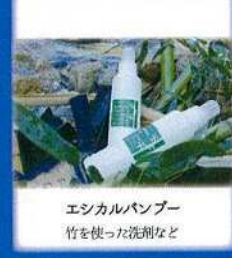
エシカルパンパー 竹を使った洗剤など