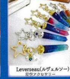
Leverseau(ルヴェルソー) 星空アクセサリー