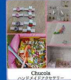
Chucola ハンドメイドアクセサリー