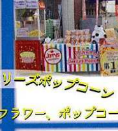
さぶあひあ&ジュエリーズポップコーン プリザーブドフラワー、ポップコーン