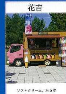
花吉 ソフトクリーム、かき氷