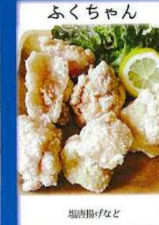
ふくちゃん 揚げ物など