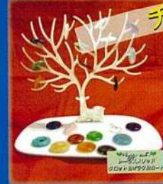
占い、布小物、クラフトバッグなど