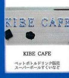
KIBE CAFE ペットボトルドリンク販売 スーパーボールすくいなど