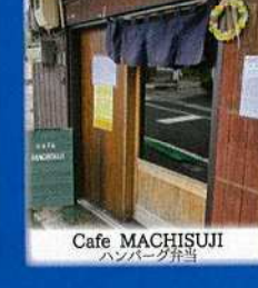
Cafe MACHISUJI ハンバーグ弁当