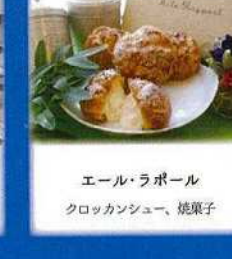
エール・ラポール クロッカッシュ、焼菓子