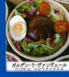
ガルデン・ラ・ヴァンヴェール ロコモコ、シシリアンライス